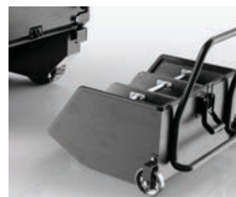
Tramoggia su ruote con mini contenitori opzionali