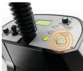
L'avvio con un solo tocco attiva tutte le funzioni principali